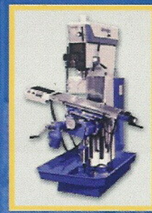
Trapano-Fresa SERRMAC TSC 40 TC VR DA