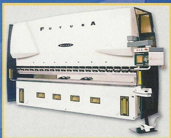
Presso piegatrice oleodinamica WARCOM FUTURA 30 - 160 ton - con programmatore CNC e tavola di centinatura automatica

Ecco alcune delle nuove macchine che attrezzano la struttura operativa: