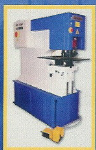
Punzonatrice OMERA OP 90 HY