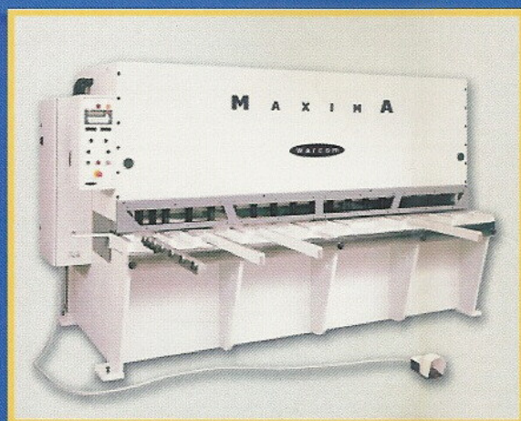
Cesoia oleodinamica WARCOM MAXIMA 30-8 con posizionatore CN